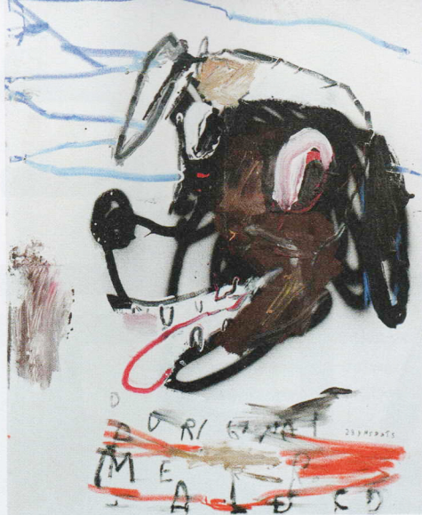
Galerie Heike Strelow: STARSKY BRINES „Perras Fantasias“, 2023 (Volta Basel)

PHOTO BASEL, 13. bis 18. Juni, photo-basel.com