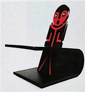
L'inspiration « totem » des sièges de la collection Quanta de 2022. Jomo Tariku