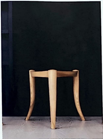
La chaise Nyala et sa version tabouret. Elle porte le nom d'une antilope des Bale Mountains, en Afrique de l'Est, en voie d'extinction. (Lorenzo Testa)