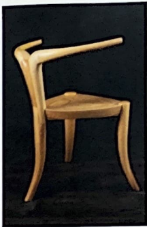
Page précédente : Les cornes de la chaise Nyala. Jomo Tariku